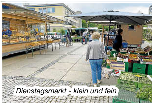
Dienstagsmarkt - klein und fein