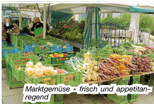
Marktgemüse - frisch und appetitierend

Und noch einen zweiten Wochenmarkt bietet die Stadt Wendlingen am Neckar. Jeden Dienstagvormittag gibt es eine kleinere Ausgabe vor allem mit Gemüse und Milchprodukten.