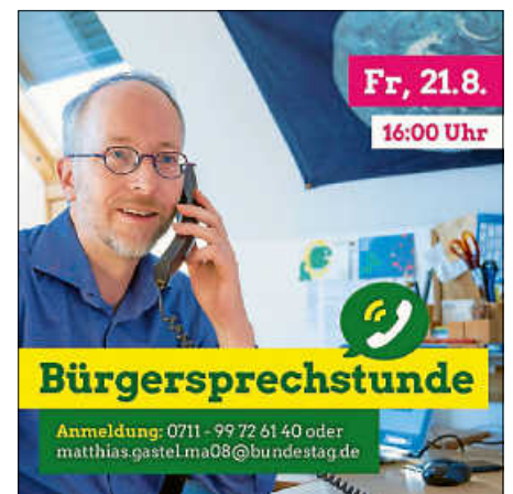
Bürgersprechstunde