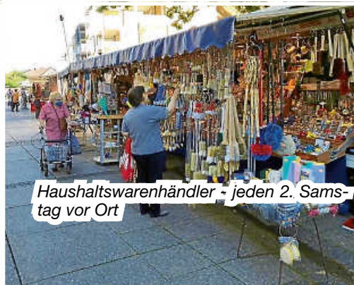
Haushaltswarenhändler - jeden 2. Samstag vor Ort