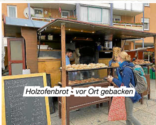
Holzofenbrot - vor Ort gebacken