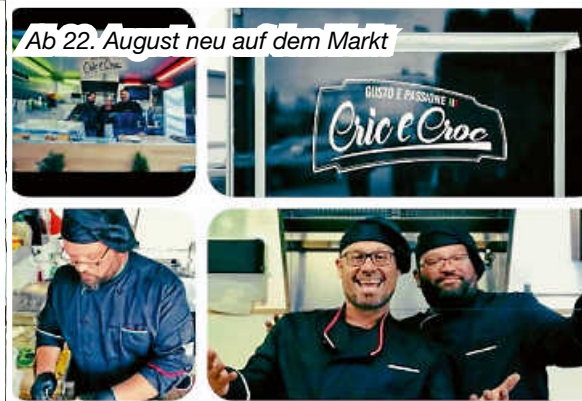
Ab 22. August neu auf dem Markt