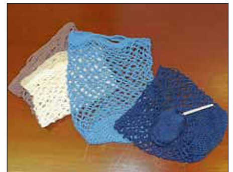
Einkaufsnetz selbst häkeln

Die eigene Tasche zum Einkauf mitzubringen, auf Plastik- und Papiertüten zu verzichten liegt voll im Trend. Roswitha Fischer, aktiv bei den Stricklieseln und Häkeltanten, zeigt, wie man aus Baumwollgarn ein stabiles Einkaufsnetz häkeln kann. Bitte bringen Sie Baumwollgarn für Häkelnadel 3,5 bis 4,5 und die entsprechend passende Nadel mit. Dieses Angebot ist kostenlos und ohne Voranmeldung. Montag, 10. Februar ab 14.30 Uhr im MiT-Café.