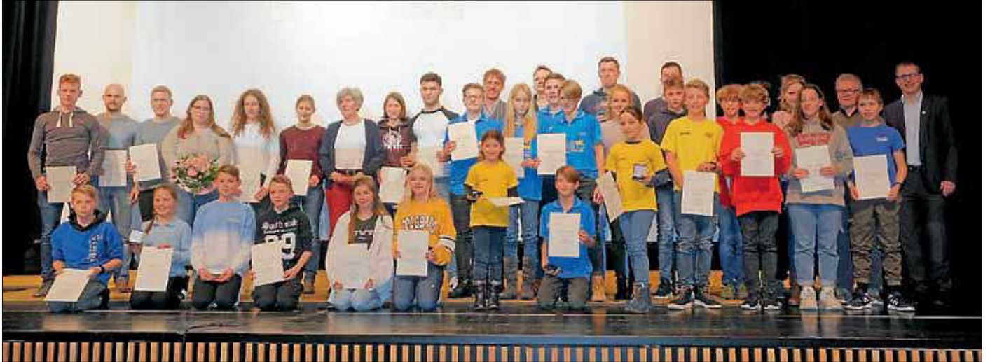
Die geehrten Sportlerinnen und Sportler

Am 13. Februar konnten wieder mehrere Sportlerinnen und Sportler für ihre Erfolge im vergangenen Jahr geehrt werden.