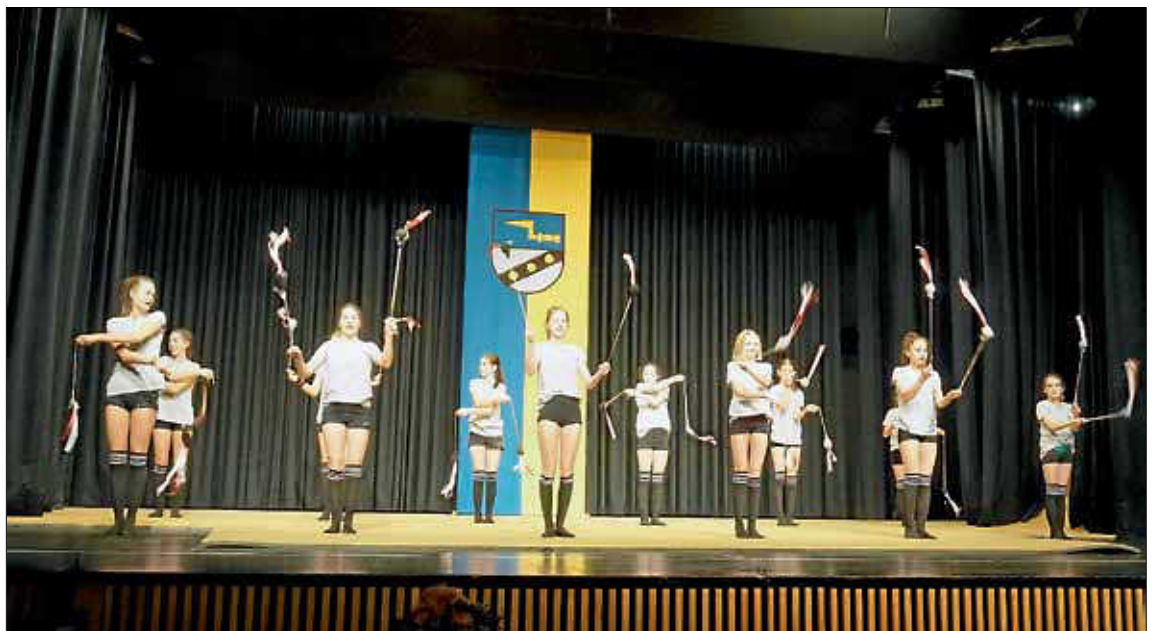
Die Turnerinnen des TSV Wendlingen zeigten zu Beginn ein kleines Showprogramm