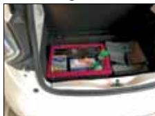
Die „Anticorona“ Ausstattung

Auch beim CarSharing in Wendlingen sind Maßnahmen ergriffen worden, um die Nutzer vor einer Ansteckung bei der Nutzung der Fahrzeuge zu schützen. So