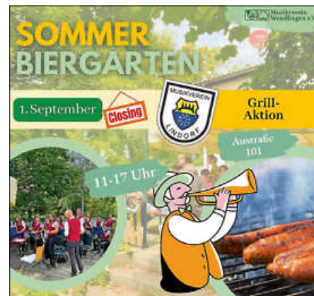
Plakat: MV Wendlingen

Der Musikverein Wendlingen lädt zum Sommerbiertgarten-Closing am Vereinsheim in der Austraße 101 ein.