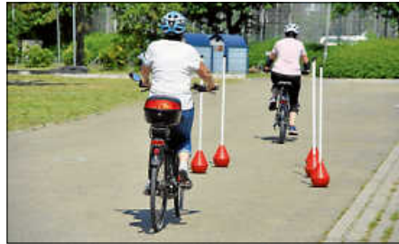
Fahrtraining erhöht die Sicherheit

Pedelec Training für Seniorinnen und Senioren