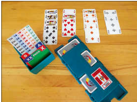
Gemeinsam Spielen fördert die geistige Fitness

Auf der ganzen Welt werden Bridge und Schach nach einheitlichen Regeln gespielt. Während Schach mehrere Jahrhunderte alt ist, ist Bridge – in seiner heutigen Form – vergleichsweise jung. So entstand die heute gespielte Form des Bridge in den 1920er Jahren. Die Wurzeln dieses Kartenspiels reichen allerdings weit zurück. Das aus England stammende Kartenspiel Whist – erstmals 1529 erwähnt – gilt als Vorläufer von Bridge. Bridge ist ein Kartenspiel für vier Personen, von denen jeweils Paare gegeneinander spielen. Gespielt mit einem französischen Blatt – 52 Karten ohne Joker. Bridge ist spannend und abwechslungsreich. Bridge spielen fördert die Konzentration, das Gedächtnis und das logische Denkvermögen.