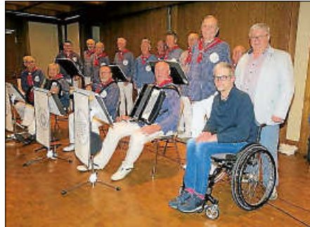
Shanty-Chor mit AMSEL-Kontaktgruppenleitung

Ein herzliches Dankeschön an die Pächter der Limburghalle für die Bewirtung, dem Hausmeister, dem Shanty-Chor und den Helfern der Creativ-Gruppe.