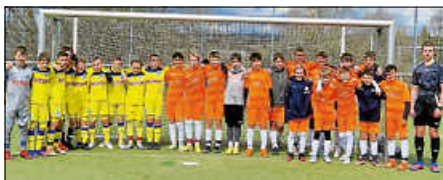
D1 und die Kickers

Ein Highlight-Testspiel hatte unsere D1 am letzten Sonntag, als die U12 der Stuttgarter Kickers zu Gast war. Nach der ersten ausgeglichenen Halbzeit ging es mit 0:0 in die Kabine. Im 2. Durchgang übernahmen die Kickers die Spielkontrolle, doch wurden sie von unseren Jungs zweimal ausgekontert, so dass wir mit 2:0 in Führung gingen. Durch einen streitbaren 9-Meter gelang den Gästen der Anschluss, ehe sie mit 2 sehenswerten Einzelleistungen einer ihrer drei überragenden Spieler mit 2:3 in Führung gingen. Dies war auch der Endstand nach regulärer Spielzeit. In den 30 Min Extraspielzeit gelangen den Kickers dann nochmals drei Treffer, als uns die Kraft ausging.