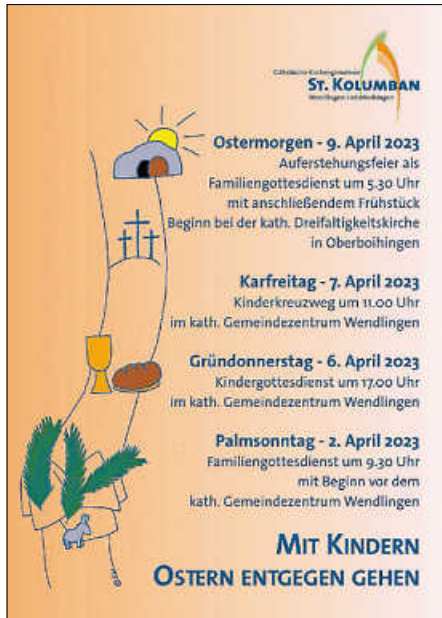
Kindergottesdienste in der Karwoche Plakat: Kath. Kirche Wendlingen